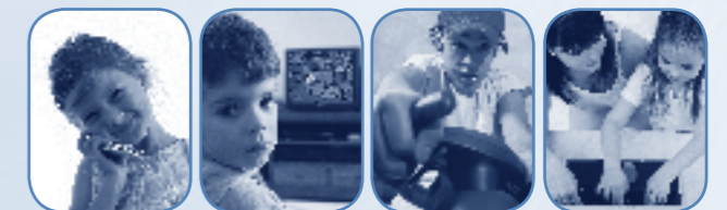
HANDY FERNSEHEN GAMES INTERNET

THEMATISCHE ELTERNABENDE ZUR MEDIENERZIEHUNG IN FAMILIE UND SCHULE www.msa-online.de