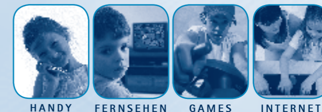
HANDY FERNSEHEN GAMES INTERNET

THEMATISCHE ELTERNABENDE ZUR MEDIENERZIEHUNG IN FAMILIE UND SCHULE www.msa-online.de