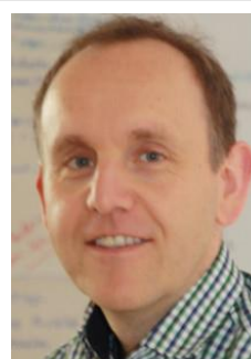
Olaf Schütte Kinder- und Jugendring e.V.