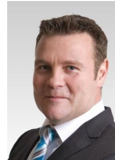
Markus Kurze (Mdl) CDU Sachsen-Anhalt