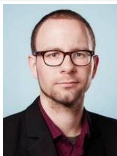
Sebastian Lüdecke Bündnis90/Die Grünen