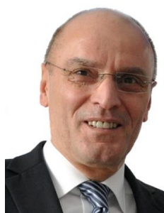
Rolf Lay Industrie- und Handelskammer